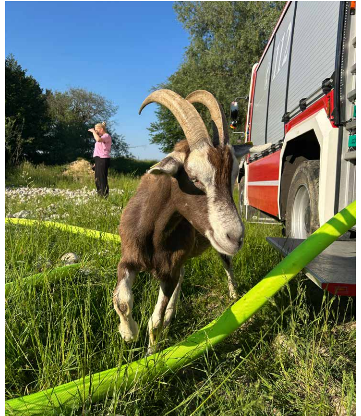
Eine Ziege inspiziert das Feuerwehrauto

Mit 20.000 l Wasser hat nun die Feuerwehr ausgeholfen. Das sollte erst einmal reichen, um zumindest die Froschbabys durch die Dürre zu bringen. Diese heißen übrigens Kaulquappen. Ihre Kindergartenzeit verbringen sie im Wasser und gehen erst später als Fröschlein an Land. Das Leben der Laubfrösche und Gelbbauchunken in der ehemaligen Kiesgrube wurde mit dieser Aktion der Feuerwehr Waldkraiburg gerettet. „Jedes Leben zählt“, sagt Zugführer Sven: „Auch das von Fröschen.“