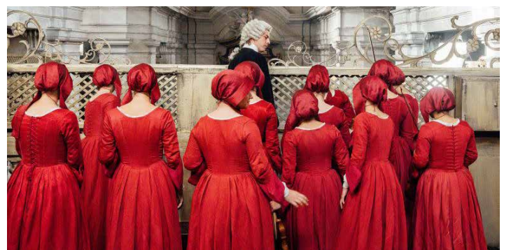
Szenenbild Vivaldi und ich

Sonntag 26. Juli, 13 Uhr: Vivaldi und ich Wiederholung Dienstag 4. August, 20 Uhr