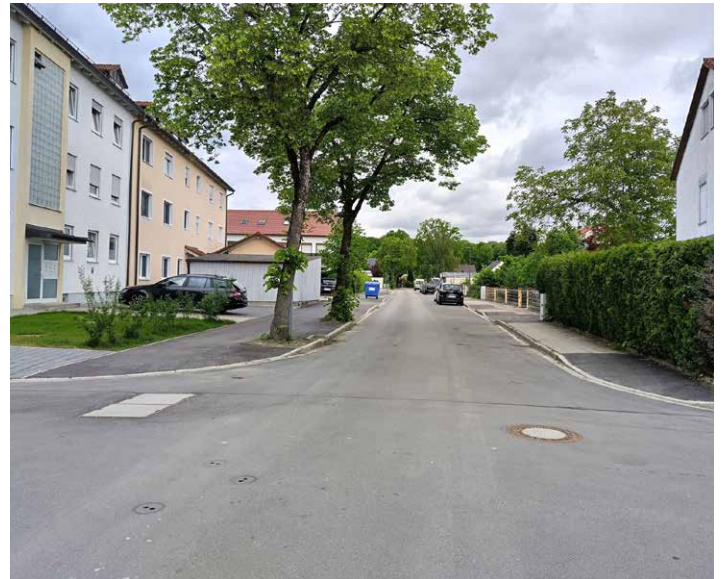
Liebigstraße nach den Grabungsarbeiten

Mit der neuen Haupttransportleitung entsteht eine leistungsfähige Fernwärmetrasse mit zusätzlicher Kapazität. Somit wird die Grundlage für den weiteren Netzausbau in den kommenden Jahren geschaffen und die Versorgungssicherheit in Waldkraiburg langfristig gestärkt. Parallel zur Fernwärme werden auch hier Wasserleitungen, Stromtrassen und Datenleitungen mitverlegt. Die Baumaßnahme stellt hohe Anforderungen an Planung und Bauablauf: Arbeiten unter Vollsperrung, die Sicherstellung von Feuerwehrezufahrten, Ampelregelungen im Bereich der Schulen sowie ein hohes