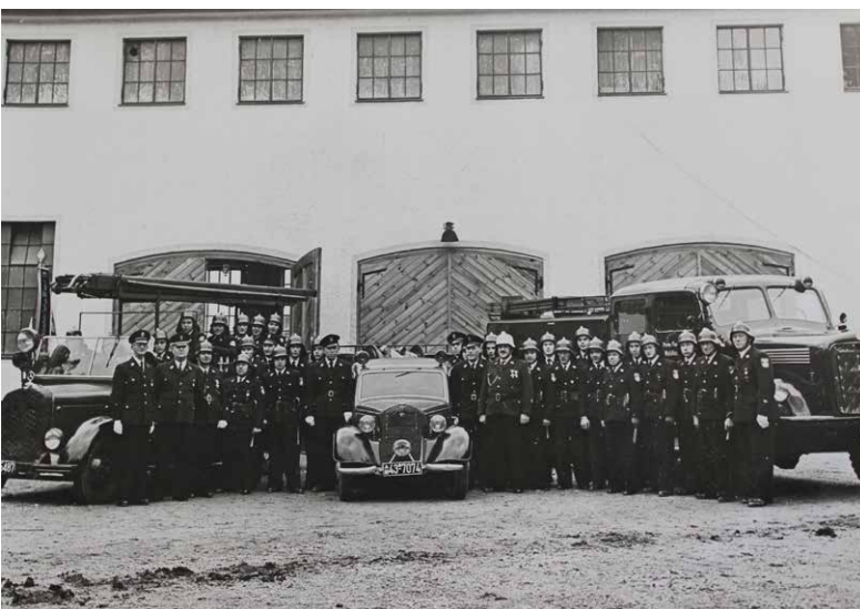
nach dem Umzug ins neue Gerätehaus Brünnerstraße

Am Freitag, 3. Juli 2026, lädt die Freiwillige Feuerwehr Waldkraiburg ins Haus der Kultur zu einem Festabend ein.