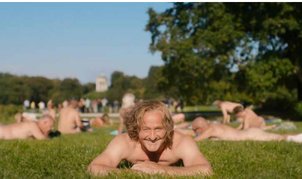
Szenenbild Ein Münchner im Himmel

Ein Münchner im Himmel - Der Tod ist erst der Anfang