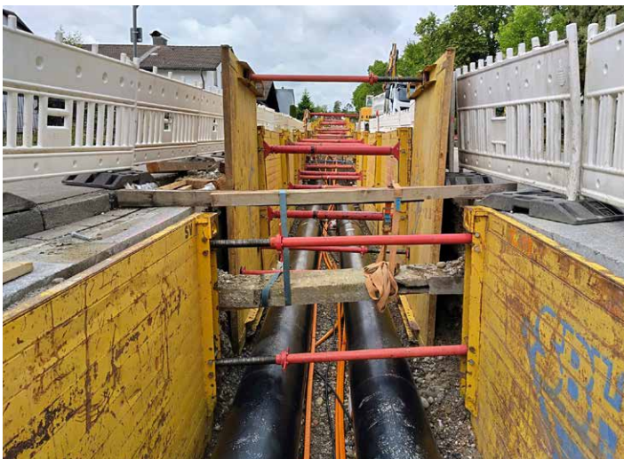
Verlegearbeiten in Richard-Wagner-Straße

Mit diesen Maßnahmen setzen die Stadtwerke Waldkraiburg ihren Weg hin zu einer zukunftsfähigen, sicheren und klimafreundlichen Wärmeversorgung konsequent fort.