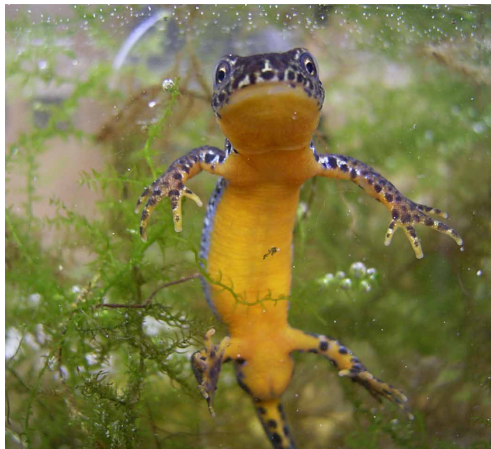
Lurchi lässt grüßen: so ein hübscher Bergmolch ist auch schon im neuen Feuchtbiotop gesehen worden. Er gehört zur Gruppe der Schwanzlurche.

Auch für private Teiche wird angeregt, möglichst kleine Teiche ohne Fischbestand anzulegen oder aber einen zweiten, kleineren Tümpel zu gestalten, in welchem die Froschbabies vor Fischen sicher sind.