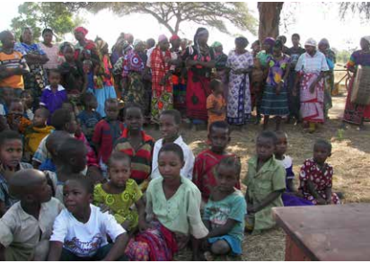
Baumkirche in Tansania

Einen außergewöhnlichen Gottesdienst feiert die evang.-luth. Kirchengemeinde Waldkraiburg am Sonntag, 10. Mai um 9.30 Uhr in der Martin-Luther-Kirche: ihren Partnerschafts-Gottesdienst! Das Besondere daran: Der Gottesdienst