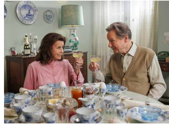
Szenenbild Ach, diese Lücke, diese entsetzliche Lücke

Man trifft sich ab 14 Uhr bei Kaffee und Gratskuchen im Kinofoyer, der Film beginnt um 15 Uhr.