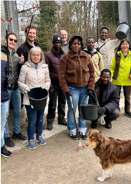
Auch im Stadtpark wurde aufgeräumt

Mit viel Tatkraft, guter Stimmung und echtem Teamgeist haben zahlreiche engagierte Bürger an der diesjährigen „Rama Dama“-Aktion teilgenommen. Ausgestattet mit Handschuhen und Müllsäcken machten sich die Helfer