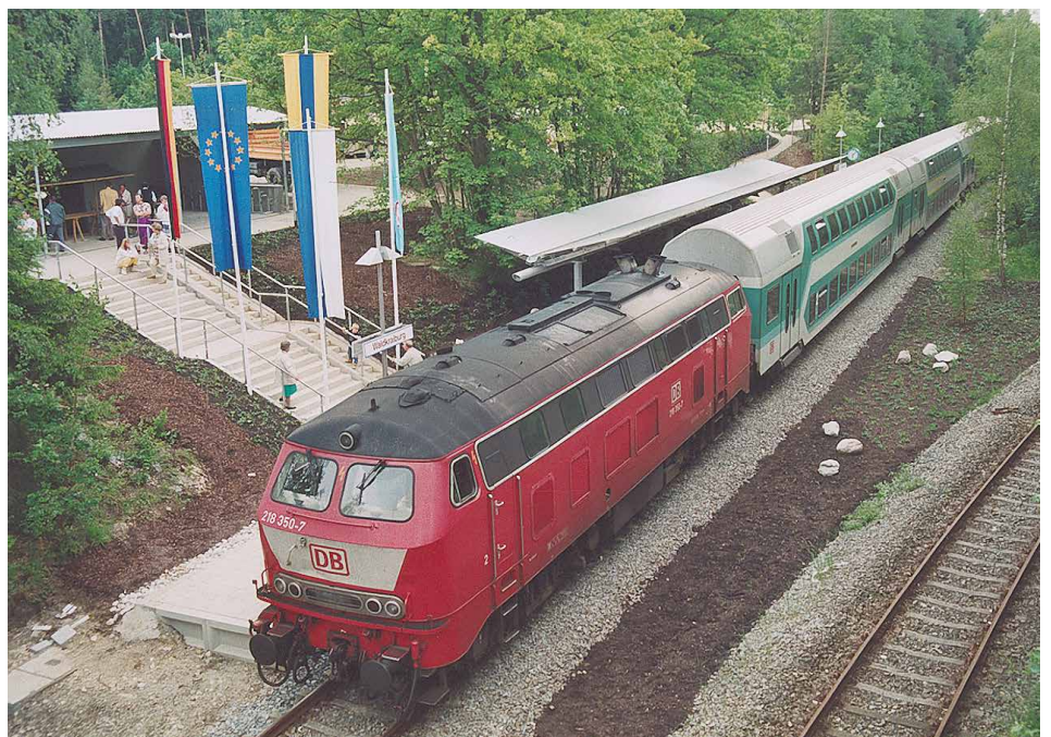
Der Bahnhofsteilpunkt am Tag der Einweihung, 28. Mai 1994.

1994 erbaute die Stadt Waldkraiburg in der Stadtmitte einen Bahnhofsteilpunkt, nachdem im selben Jahr die Bahnlinie endlich nach neun Jahren Stillstand wieder eröffnet wurde.