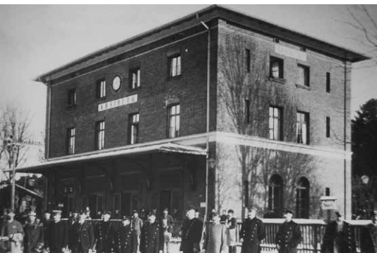
Die Belegschaft des Kraiburger Bahnhofs, um 1900.

Am 1. Mai 1876, das liegt nun 150 Jahre zurück, wurde die Innthalbahn zwischen den Innstädten Mühldorf, Wasserburg und Rosenheim eröffnet. Die Bahnstation Kraiburg war einer von sieben Bahnhöfen, welcher an diesem Tag seinen Betrieb aufnahm. Aber die Station mit der Bezeichnung „Kraiburg“ hätte damals ortsunkundige Reisende schnell verwirren können. Denn wenn jemand am Kraiburger Bahnhof ausstieg, konnte er von seinem Reiseziel „Kraiburg am Inn“ weit und breit nichts erkennen. Der Kraiburger Bahnhof wurde nämlich inmitten des gemeindefreien Mühldorfer Harts errichtet. Wie kam es zu dieser kuriosen Situation?