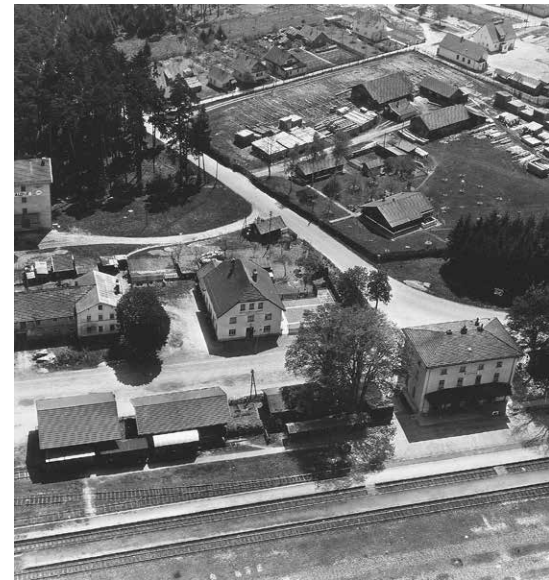
Der Bahnhof, mehrere Lagerhallen, die beiden Gasthäuser und das Sägewerk Kaltner, 1957.

Waldkraiburg nicht entstanden wäre - schon seit nun 36 Jahren im tiefen „Dörrschlaf“. Bis jetzt konnte kein „Prinz“ gefunden werden, der dem alten Gemäuer in Form einer guten Geschäftsidee wieder neues Leben einhauchen könnte. Zumindest konnte die Stadtbau Waldkraiburg GmbH 2010 durch den Erwerb einem drohenden Abriss zuvorkommen.