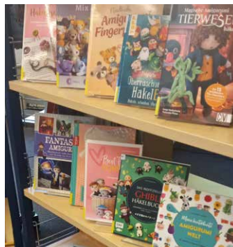
Die Stadtbücherei hält zahlreiche Amigurumi-Anleitungen in Buchform zum Ausleihen bereit. Mit ihrer Hilfe lassen sich die schönsten Häkel-Kleinigkeiten erschaffen.

Von hier aus ist es nur noch ein kleiner