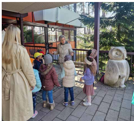
An der Eulenskulptur vor dem Haus des Buches beginnt für die Vor-Vorschulkinder die Geschichte von Eule Silva und Eichhörnchen Nappi.

Lebhaft geht es in der Stadtbücherei auch außerhalb der regulären Öffnungszeiten zu. Am frühen Vormittag tummeln sich das ganze Jahr über allerhand Kindertrupps im Haus des Buches. Sie sind eingeladen, die Bücherei zu entdecken. Die Klassen und Gruppen kommen aus allen Waldkraiburger KiTas und Grundschulen.