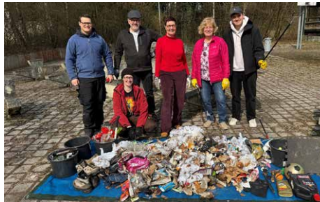
Insgesamt wurden 1.110kg Müll gesammelt

Neben dem praktischen Einsatz für eine saubere Umwelt stand vor allem das Miteinander im Mittelpunkt. Viele Teilnehmende nutzten die Gelegenheit, sich auszutauschen und gemeinsam aktiv etwas für ihre Stadt zu tun.