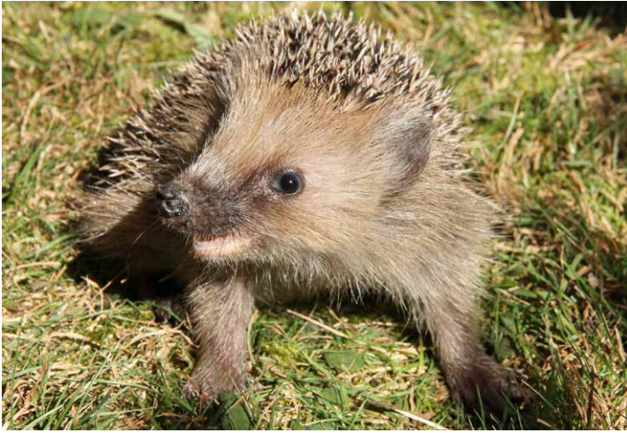
Der Igel im Garten, ein gern gesehener Gast.

BUND Naturschutz bedauert falschen Eindruck sehr