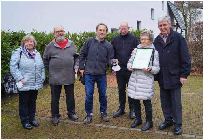
Der Eine-Welt-Laden „Steg“ freut sich sehr über die Verleihung des Umwelttalers durch den BUND.