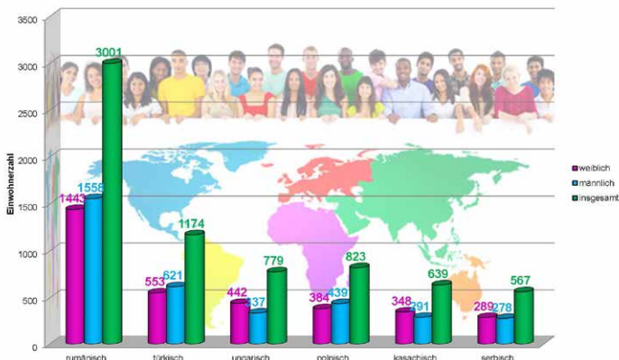
Häufigsten ausländischen Staatsangehörigkeiten in Waldkraiburg Stand: 31.12.2021

Waldkraiburg wächst weiter. Zum Stichtag 31.12.2021 waren in der Stadt 26.076 Einwohner gemeldet.