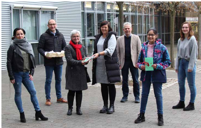
74 Weihnachtskarten für die Bewohner zweier Seniorenheime entstanden vor Weihnachten

Soziales Engagement ist besonders in der Vorweihnachtszeit wesentlicher Bestandteil des schulischen Lebens am Gymnasium Waldkraiburg. Auch wenn erneut corona-bedingt der traditionelle Weihnachtsbasar ausfallen musste und damit aus dem Erlös auch keine Spenden weitergegeben werden konnten, gab es Gelegenheiten, sozial aktiv zu werden.