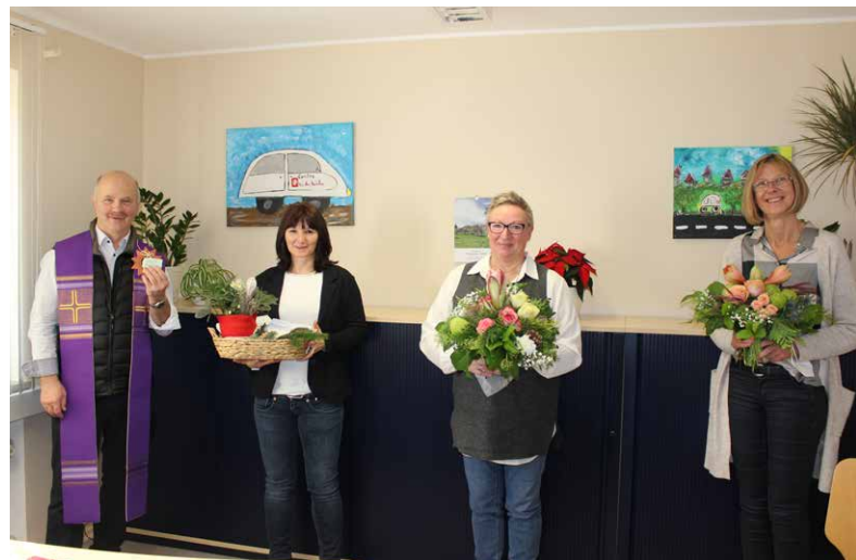
Segnung der Anlaufstelle des Ambulanten Pflegedienstes

Wenn Sie zum Thema Ambulante Pflege Fragen haben oder einen Beratungstermin wünschen, können Sie sich gerne melden unter: