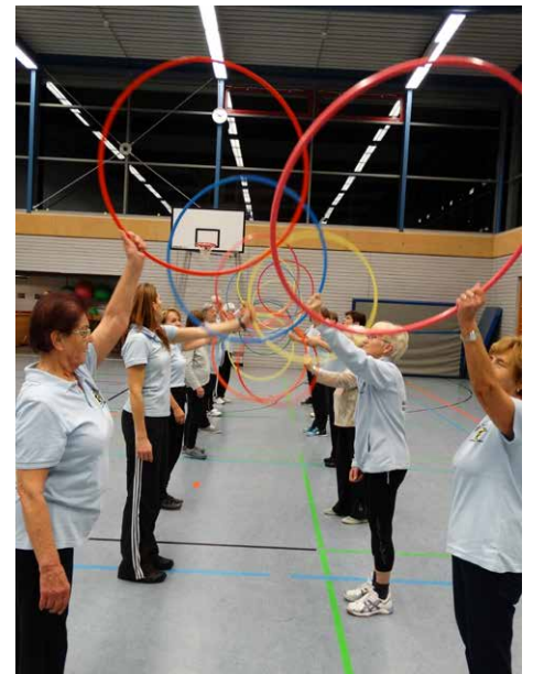
Die Gymnastik-Gruppe in der Dreifachturnhalle.

Desinfektionsmaterial wird wieder bereitgestellt. Natürlich kann auch persönliches Desinfektionsmaterial Verwendung finden und Abstand halten untereinander gilt immer noch.