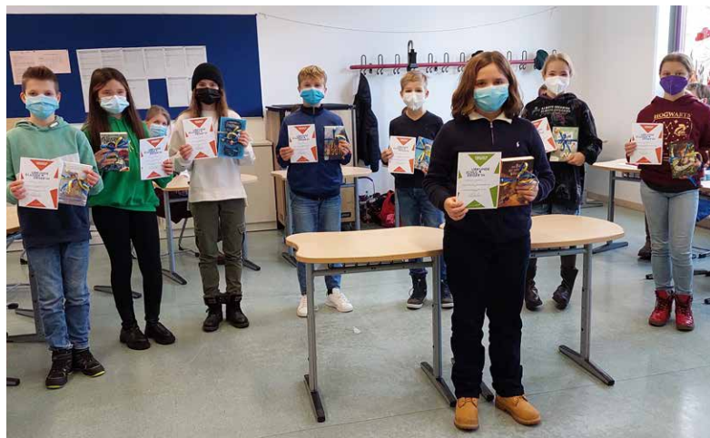
Die Teilnehmer des diesjährigen Vorlesewettbewerbs

der Buchhandlung Herzog zur Verfügung gestellt wurden, honoriert.