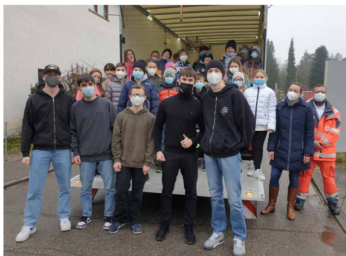
Auch im letzten Jahr packten die Schüler wieder Päckchen für die Johanniter Weihnachtstrucker

Mittlerweile ist es schon eine sehr langjährige Tradition, dass alle Klassen im Rahmen des Religions- und Ethikunterrichts Pakete für die Weihnachtstrucker-Aktion der Johanniter packen. Und so übergaben am 14. Dezember Schüler aus der fünften und elften Klasse, stellvertretend für ihre Mitschüler, voller Stolz über dreißig Pakete, gefüllt mit Lebensmitteln, Süßigkeiten, Körperpflegeartikeln und einem kleinen Geschenk, an die Johanniter. Alle freuten sich, besonders in diesen schweren Zeiten, Kinder und Familien in Osteuropa zu unterstützen und ihnen eine kleine Freude bereiten zu können und dankten auch den Johannitern, dass sie sich auch in dieser schwierigen Pandemiezeit darum kümmern, die Päckchen an ihr Ziel zu bringen.