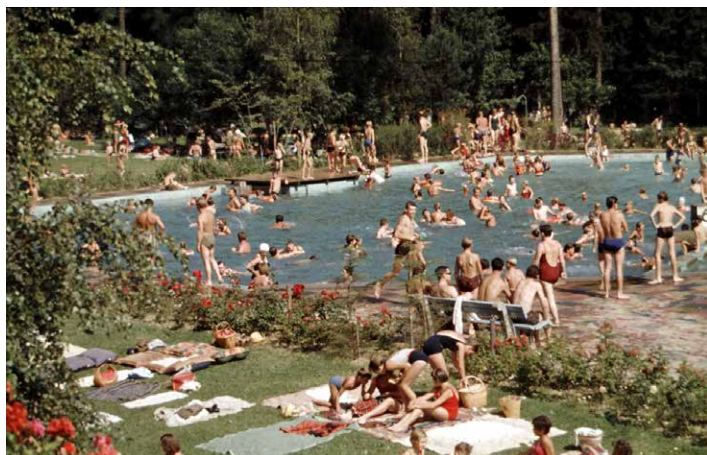
Badegäste im alten Waldbad, um 1960

Letztes Jahr feierte das Waldbad 50-Jähriges Jubiläum. Vor dem Start der letzten Saison im bekannten Gewand blickt die diesjährige Jubiläumsausstellung im Haus der Kultur auf die lange und ereignisreiche Geschichte des Waldkraiburger Waldbades zurück und wirft mit den Wettbewerbsentwürfen einen Blick in die Zukunft. Vorbereitet wird die Ausstellung vom Stadtmuseum Waldkraiburg gemeinsam mit dem Förderverein Waldbad, mit den VfL Piranhas und den Stadtwerken Waldkraiburg.