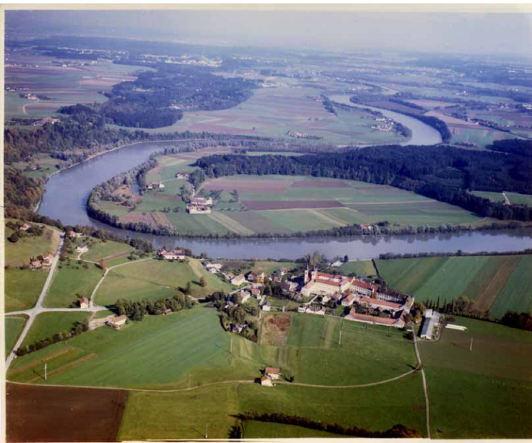
Eine Luftaufnahme zeigt das Kloster Au am Inn

Au am Inn zählt zu den geschichtsträchtigsten Orten im Landkreis Mühldorf. Bereits um das Jahr 750 gründeten die beiden Priester Baldun und Hrodbertus eine klösterliche Missionszelle - in der Amtszeit des hl. Bischofs Virgil von Salzburg (745-784). Bei den Einfällen der Ungarn um das Jahr 900 wurde die Zelle vermutlich zerstört. Offenbar blieben aber Reste der Siedlung bestehen. Denn als z.B. im Jahr 1050 der Pürtener Isengaugraf Chadalhoch III. und seine Gattin Irmingard ihren Herrenhof dem Salzburger Erzbischof Baldiun (1041-1060) schenkten, erhielten sie im Tausch einen Herrenhof in Au am Inn als Alterssitz.