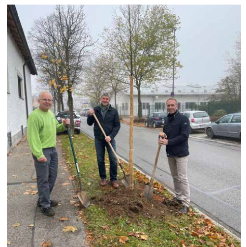
Auch die Stadt Waldkraiburg beteiligte sich an der Aktion und pflanzte mehrere Bäume im Stadtgebiet.

Um auch die Frühjahrssaison mitzunehmen hat die Stadt die Möglichkeit, Zuschüsse zu beantworten verlängert! Die Rechnungen können bis zum 31. März